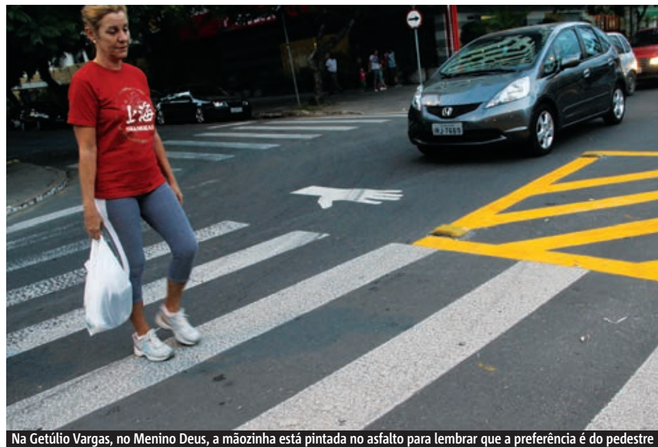
Na Getúlio Vargas, no Menino Deus, a mãozinha está pintada no asfalto para lembrar que a preferência é do pedestre